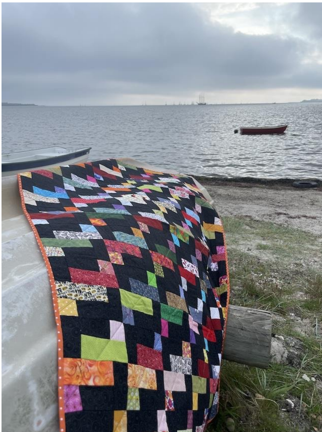
Foto taget på Fur

Denne meget smukke og enkelt restetæpper har en flot virkning. Tæppet hedder Assens og består kun af 3 forskellige figurer.